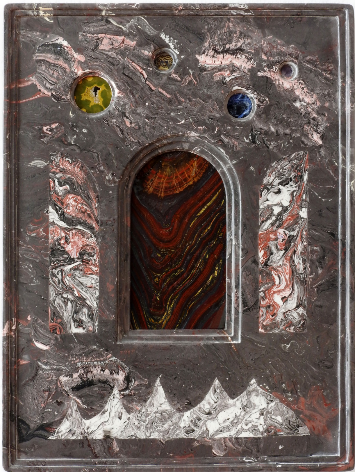
Hell, 2025. Scagliola (plaster), pigment, jasper, iron tiger's eye, sphalerite, sodalite, amethyst. 27 x 36 cm. Enfer, 2025. Scagliola (plâtre), pigment, jaspe, œil de fer, sphalérite, sodalite, améthyste. 27 x 36 cm.