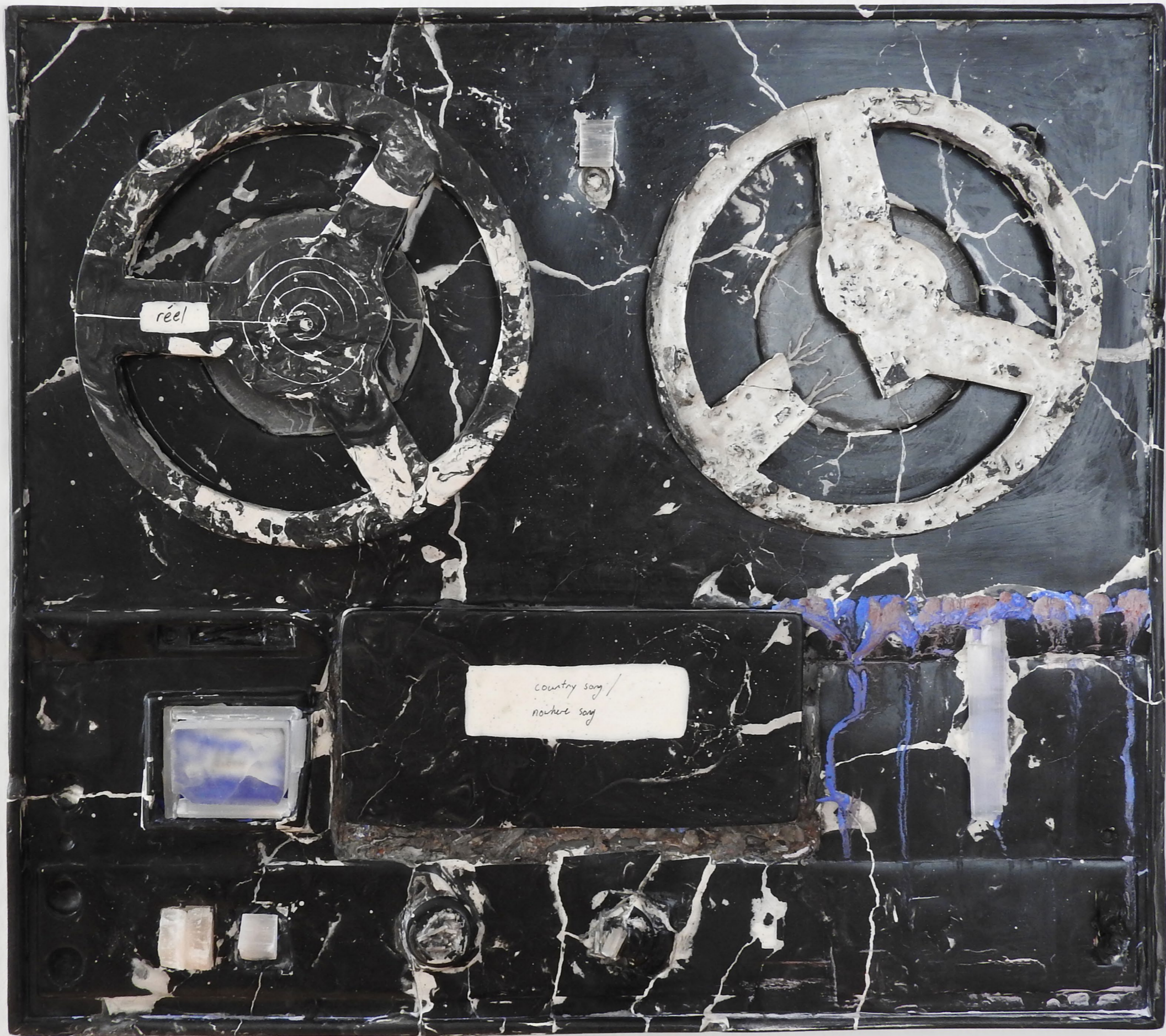
Tape machine #1 (Country song / Nowhere song), 2023. Scagliola (plaster), pigments, oil, alabaster. 38 x 34 cm. Tape machine #1 (Country song / Nowhere song), 2023. Scagliola (plâtre), pigments, huile, albâtre. 38 x 34 cm.