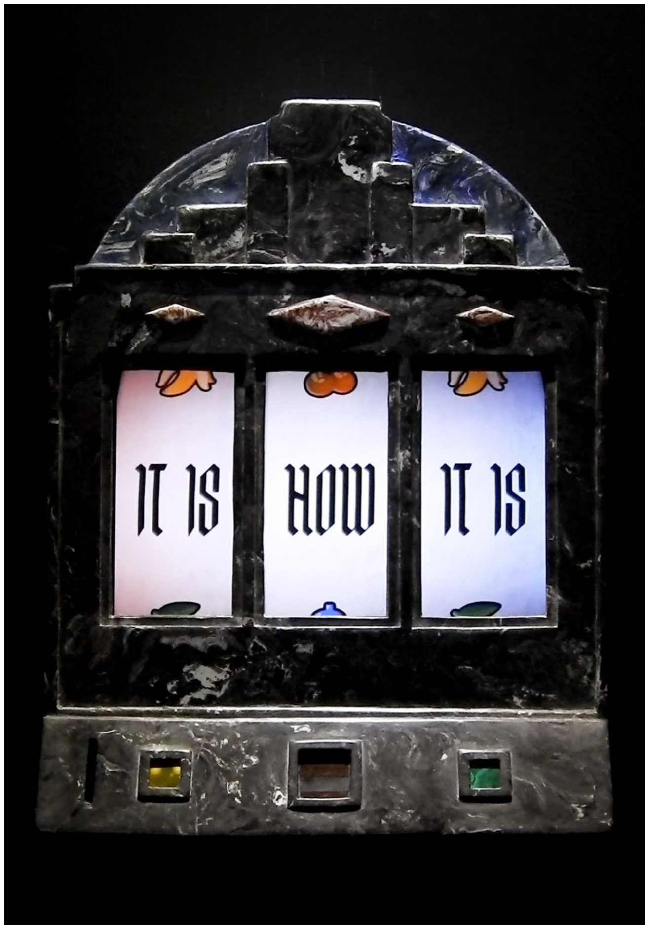
Slot machine (IT IS / HOW / IT IS) , 2025. Scagliola (plaster), pigment, jasper, iron tiger's eye, malachite, electronics. 27 x 36 cm. A game of chance which perpetually unfurls, without control. Machine à sous (IT IS / HOW / IT IS) , 2025. Scagliola (plâtre), pigment, jaspé, œil de fer, malachite, électroniques. 27 x 36 cm. Un jeu de hasard qui se déroule perpétuellement, sans contrôle.

Video: https://www.instagram.com/p/DHdu_5KK69e/ IT IS / HOW / IT IS FOR / FOR / EVER 🔄 / ✨ / ❤️ & other poems