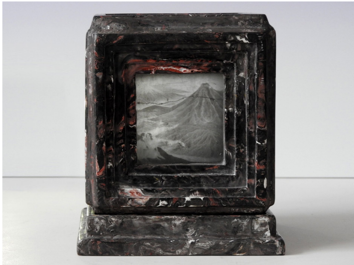
Detail of Daydream with volcanic landscape . Détail de Rêverie avec paysage volcanique .