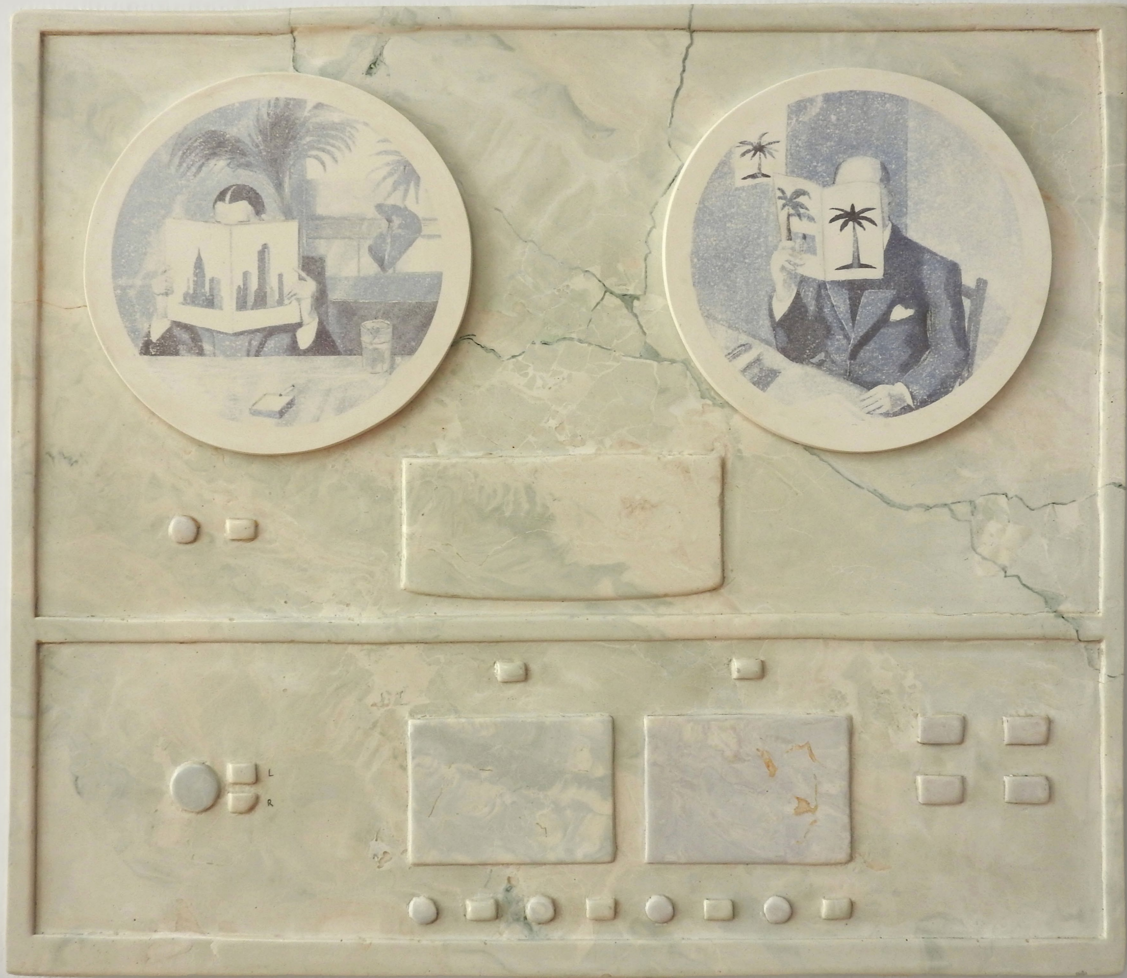
Tape machine #3 (Natural harmony) , 2023. Scagliola (plaster), pigments, oil. 43 x 37 cm. Tape machine #3 (Natural harmony) , 2023. Scagliola (plâtre), pigments, huile. 43 x 37 cm.