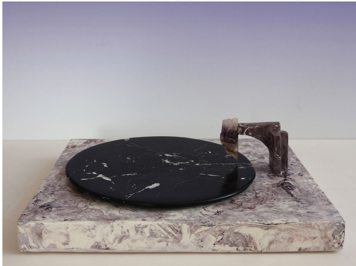
7" (20 July 2023, Brussels), 2023. Scagliola (plaster), pigments, oil, amethyst. 25 x 21 x 9 cm. 7" (20 juillet 2023, Bruxelles), 2023. Scagliola (plâtre), pigments, huile, améthyste. 25 x 21 x 9 cm.