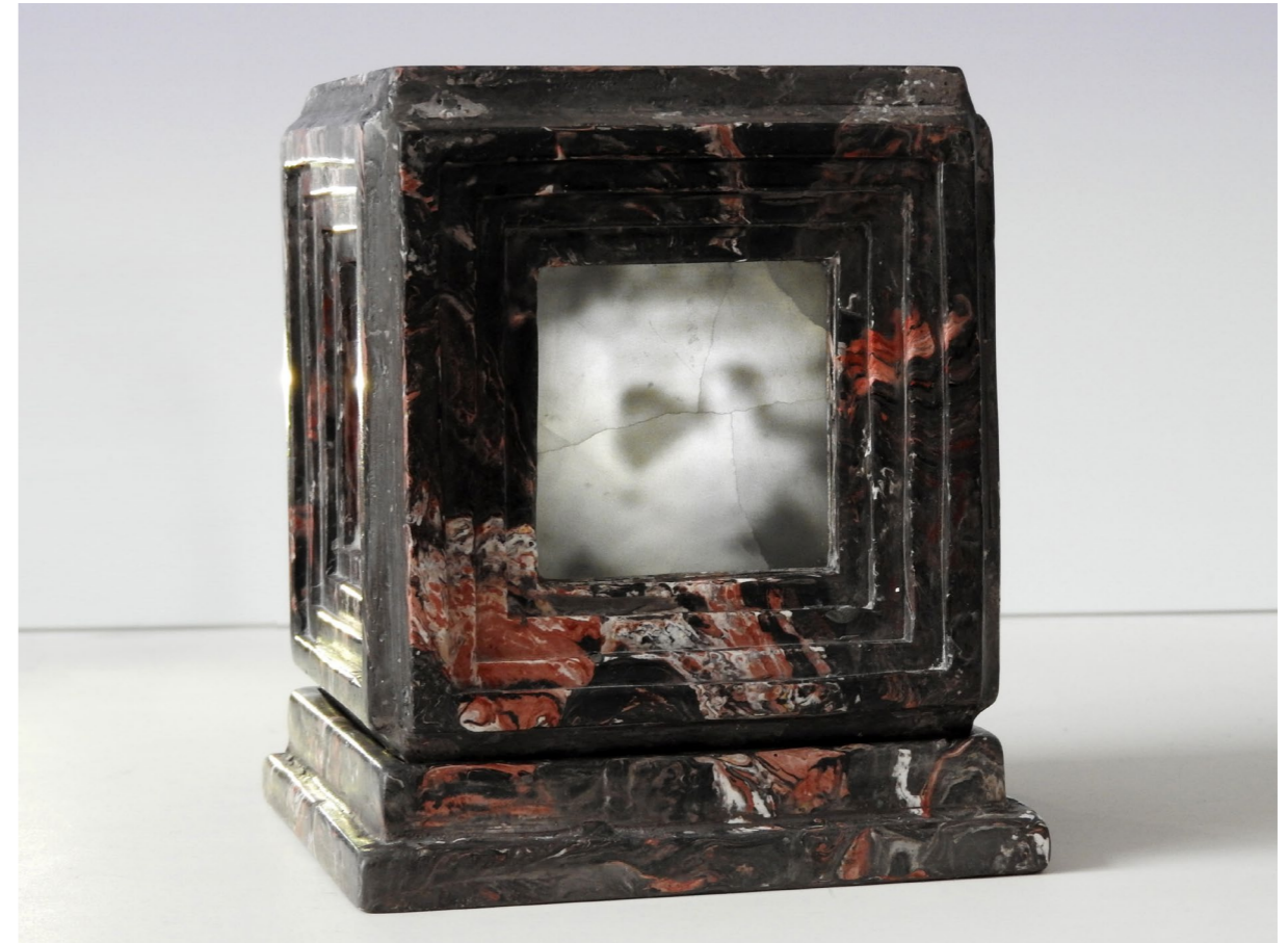
Daydream with volcanic landscape , 2025. Scagliola (plaster), pigments, alabaster. 11 x 11 x 13 cm. A unique perspective cube, evoking an erotic digital image or a surreal landscape, shifting into vision according to refractive properties of alabaster.