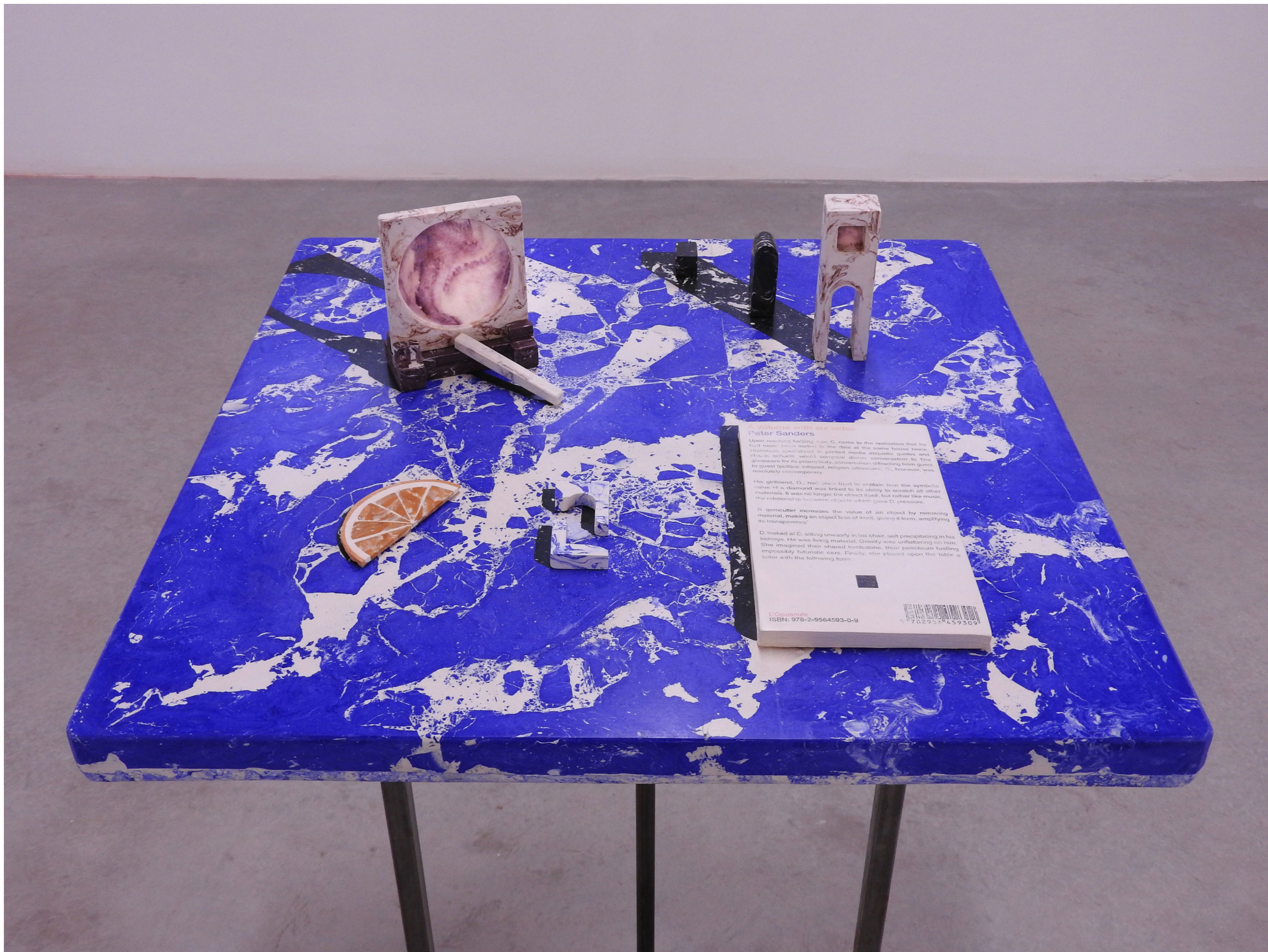
Still life (A volume with six sides) , 2022. Scagliola (plaster), pigments, oil, metal. 50 x 50 x 85 cm.