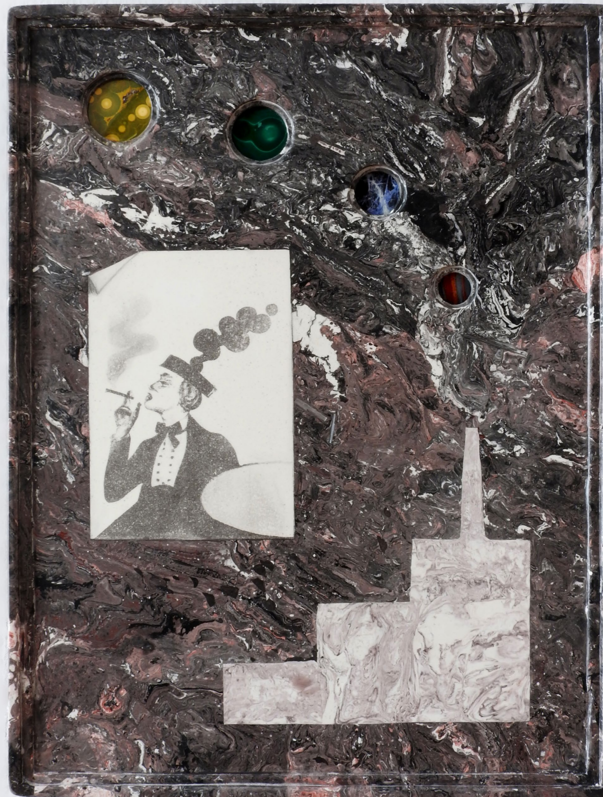
Factory with cabaret drawing, 2025. Scagliola (plaster), pigment, jasper, malachite, sodalite, iron tiger's eye. 27 x 36 cm. Usine avec dessin de cabaret, 2025. Scagliola (plâtre), pigment, jaspe, malachite, sodalite, œil de fer. 27 x 36 cm.