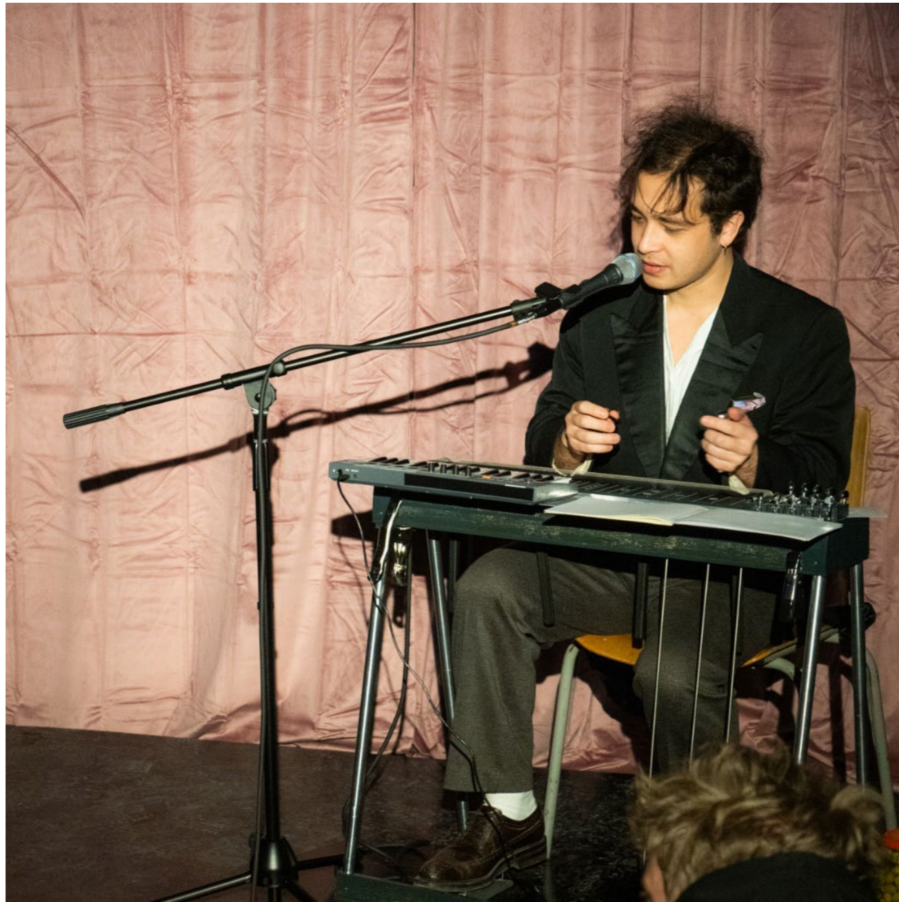
Performance on pedal steel with the collective Bienvenue. Performance sur pedal steel avec la collective Bienvenue.

Video on 2024 exhibition White Noise: https://www.instagram.com/p/DE4nLRvtrlv/