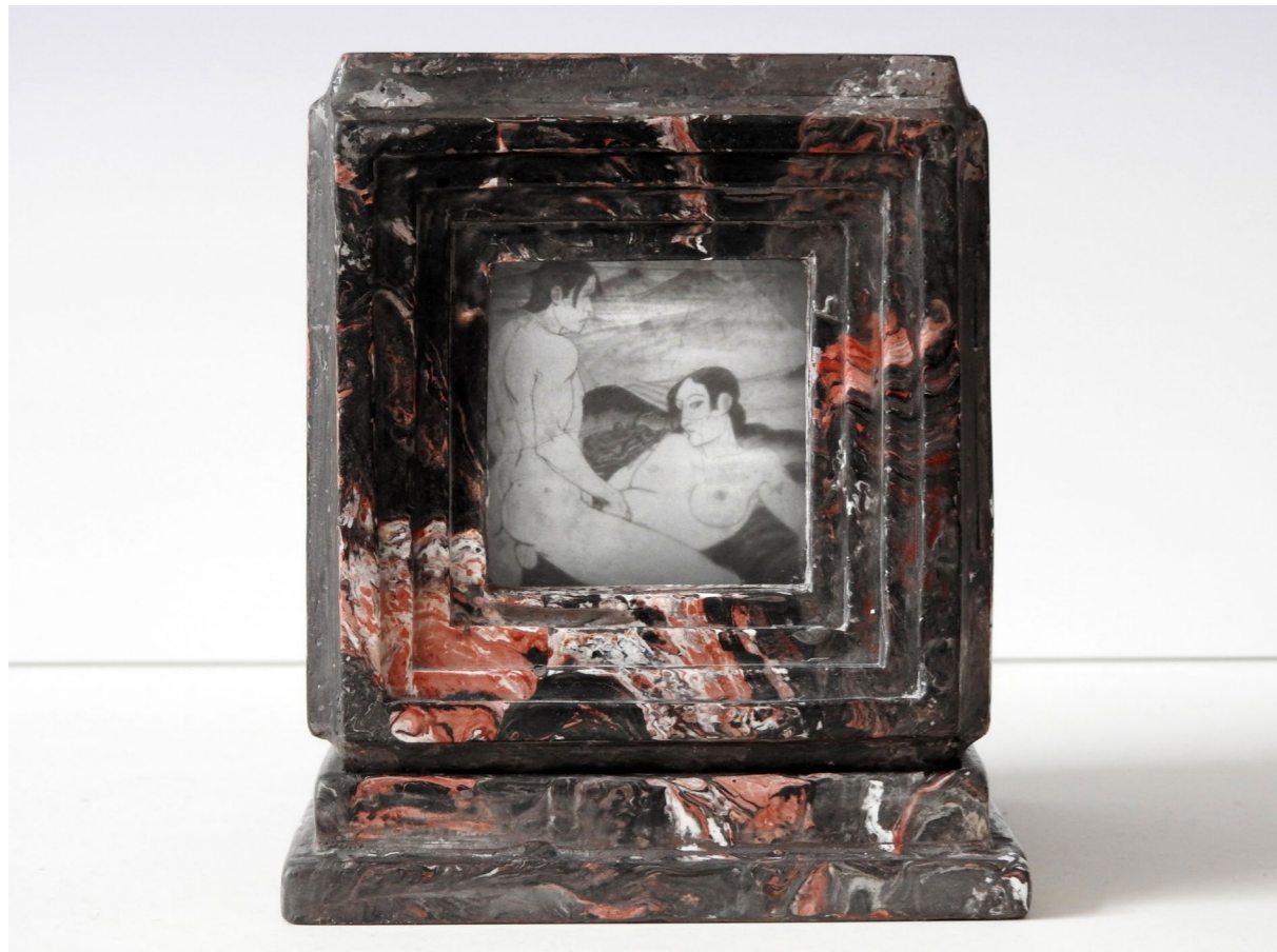
Detail of Daydream with volcanic landscape . Détail de Rêverie avec paysage volcanique .