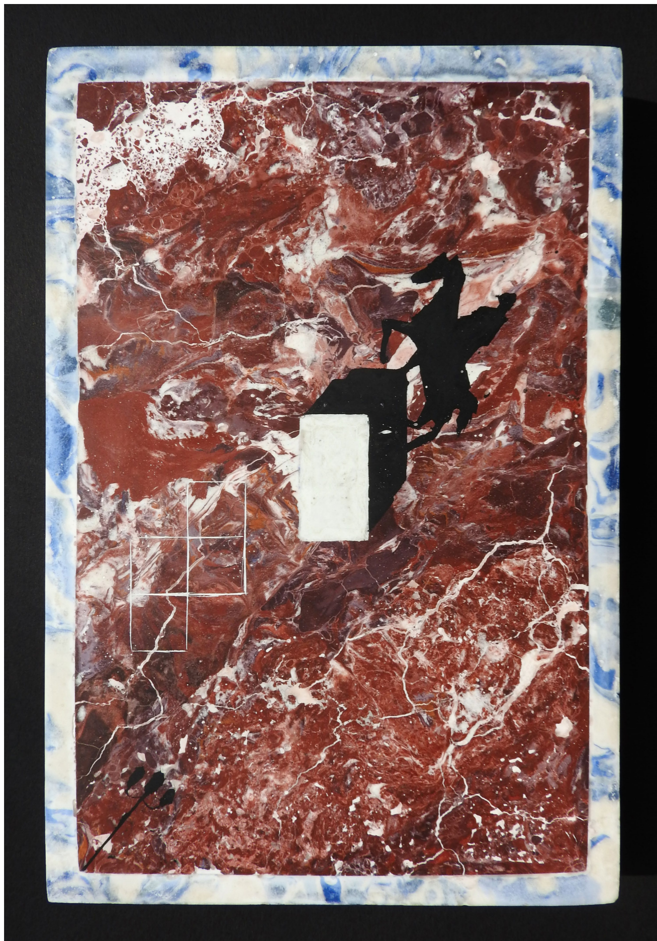
Plan for an equestrian statue, 2021. Scagliola (plaster), pigments, oil. 15.5 x 24 cm.

Plan pour une statue équestre, 2021. Scagliola (plâtre), pigments, huile. 15.5 x 24 cm.