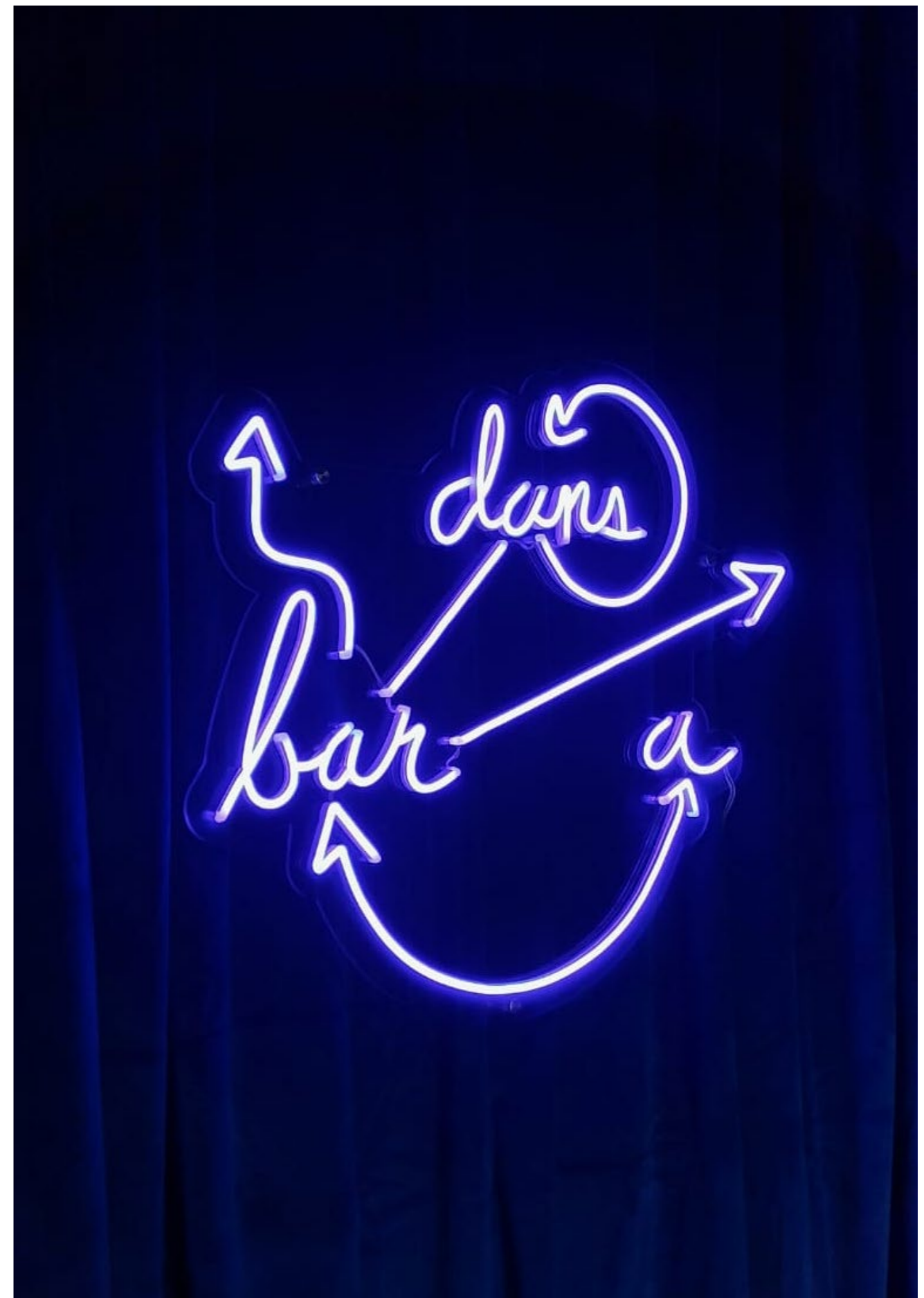
Dansbaar , 2025. LED on acrylic. 50 x 50 cm. Dansbaar , 2025. LED sur acrylique. 50 x 50 cm.

Video: https://www.instagram.com/p/DHdu_5KK69e/ IT IS / HOW / IT IS FOR / FOR / EVER 🔄 / ✨ / ❤️ & other poems