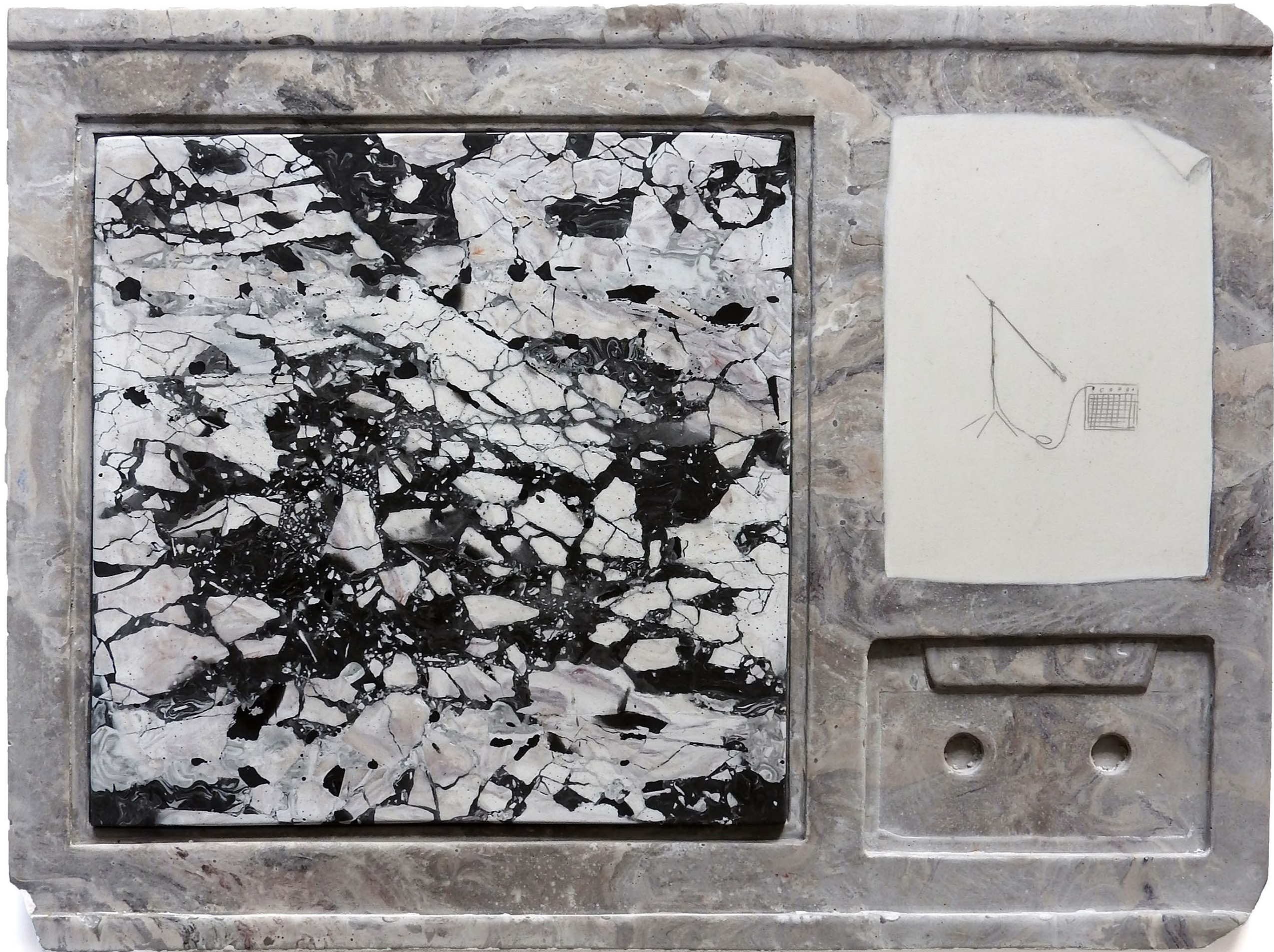
Feedback , 2024. Scagliola (plaster), pigments, oil. 36 x 27 cm. Feedback , 2024. Scagliola (plâtre), pigments, huile. 36 x 27 cm.