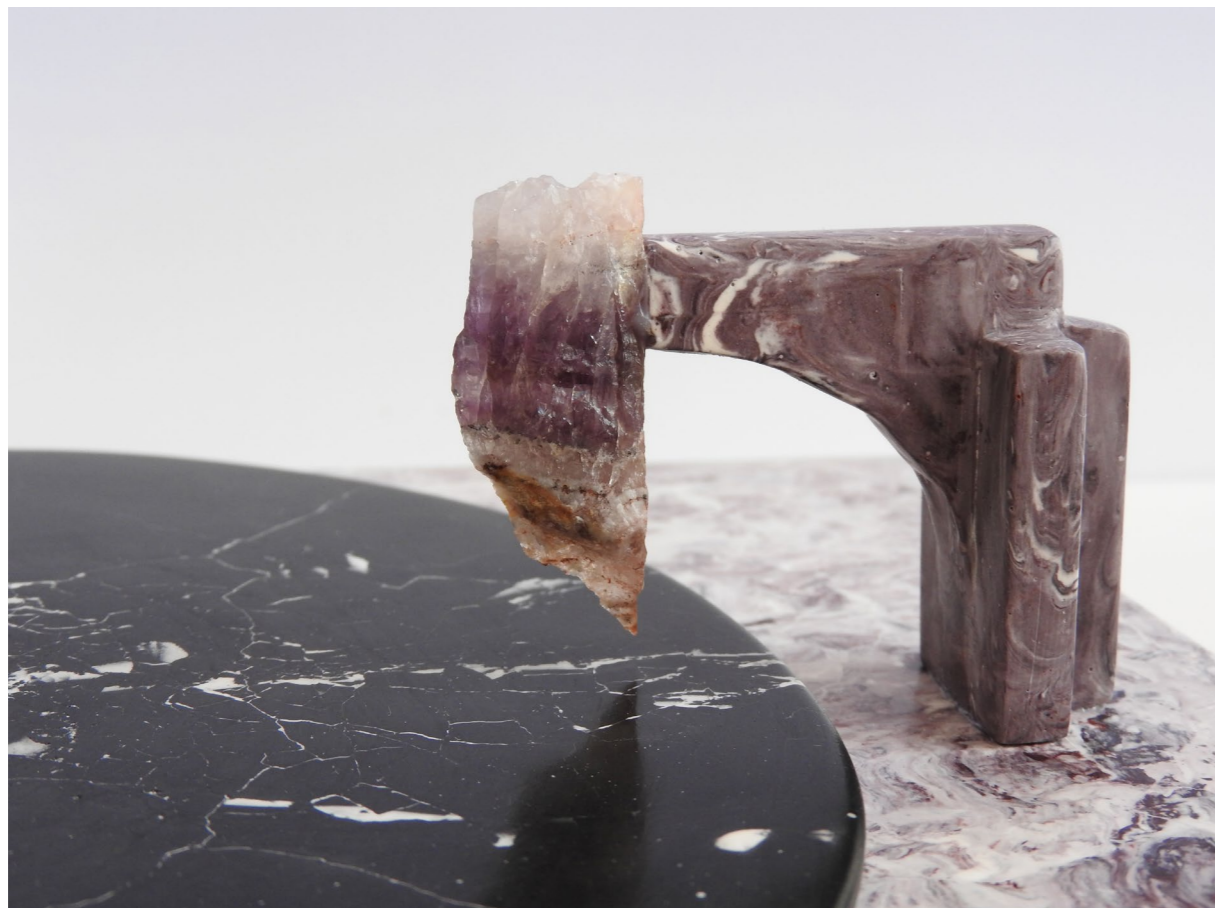
Detail of 7" (20 July 2023, Brussels). Détail de 7" (20 juillet 2023, Bruxelles).