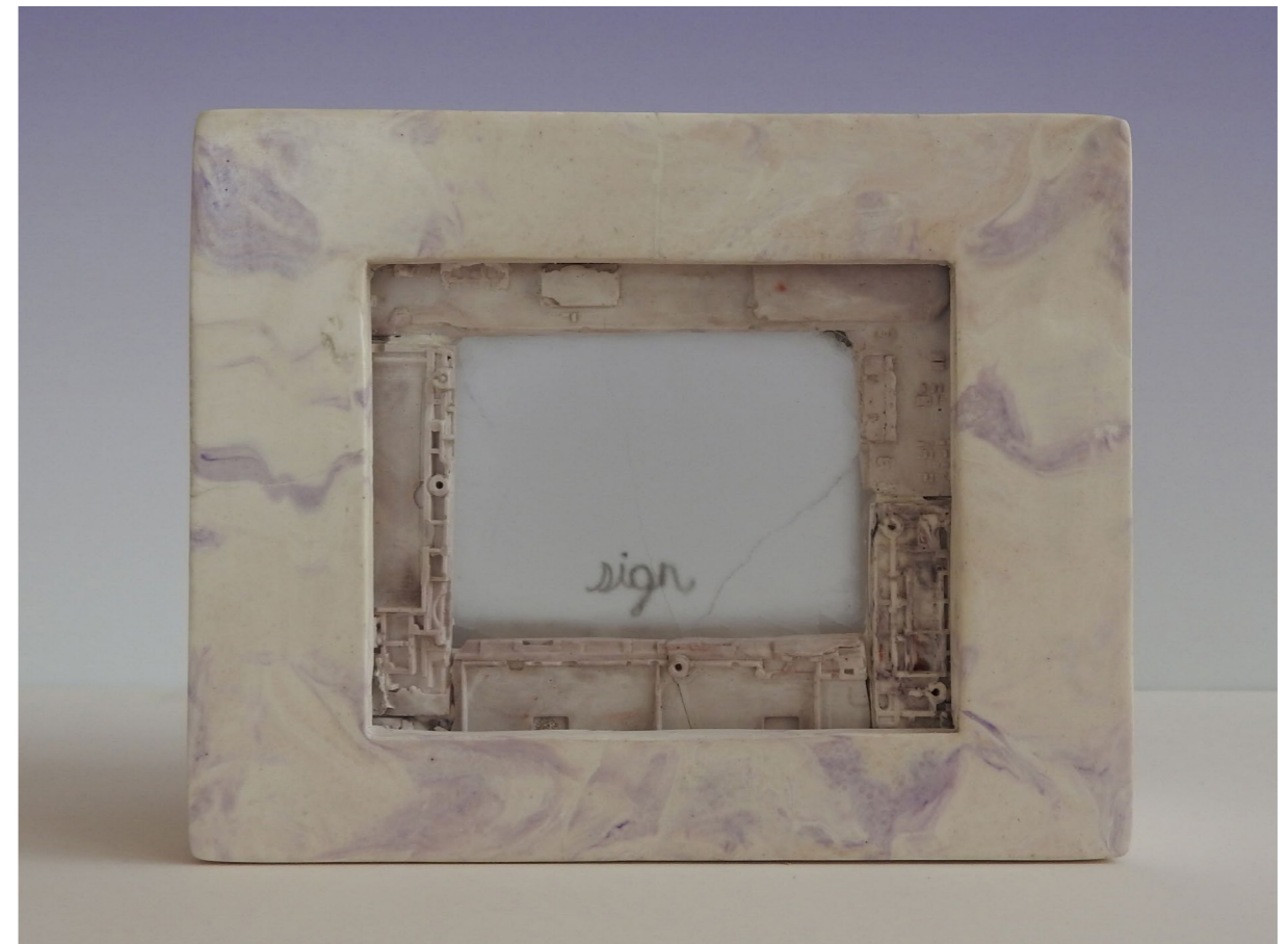
Sign (6 July 2023, Brussels), 2023. Scagliola (plaster), pigments, oil, alabaster. 13 x 4 x 10 cm. Signe (6 juillet 2023, Bruxelles), 2023. Scagliola (plâtre), pigments, huile, albâtre. 13 x 4 x 10 cm.